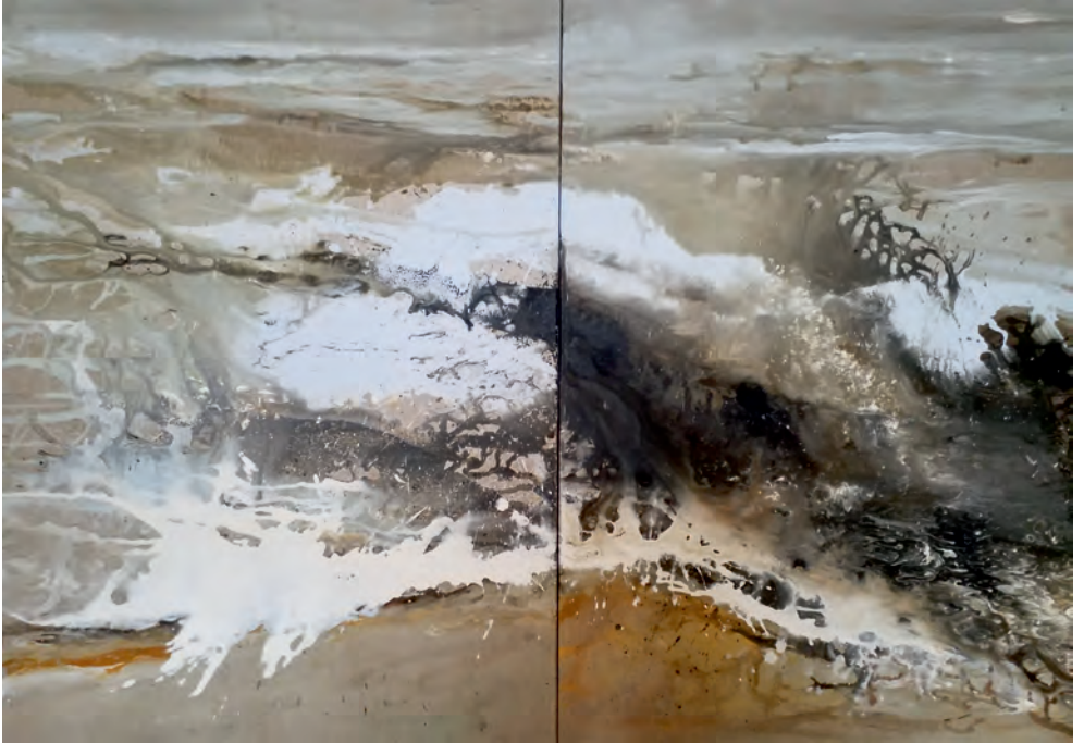
Brandung | 2018 140 x 200 cm | Acryl auf Leinwand