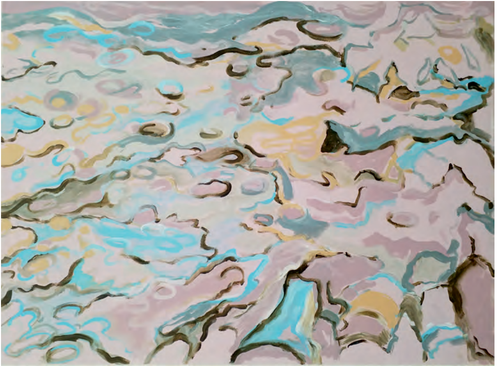
Fehmarn 6 | 2021 60 x 80 cm | Acryl auf Leinwand