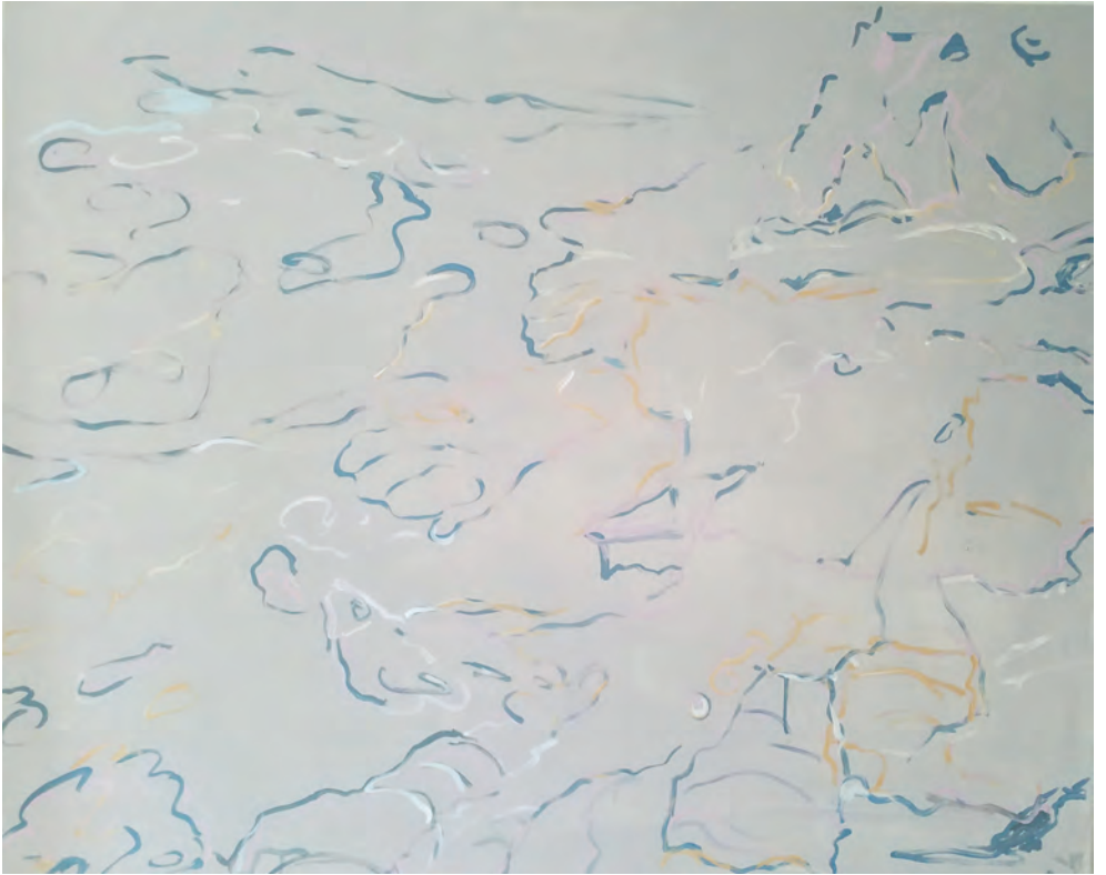
Fehmarn 2 | 2021 100 x 120 cm | Acryl auf Leinwand