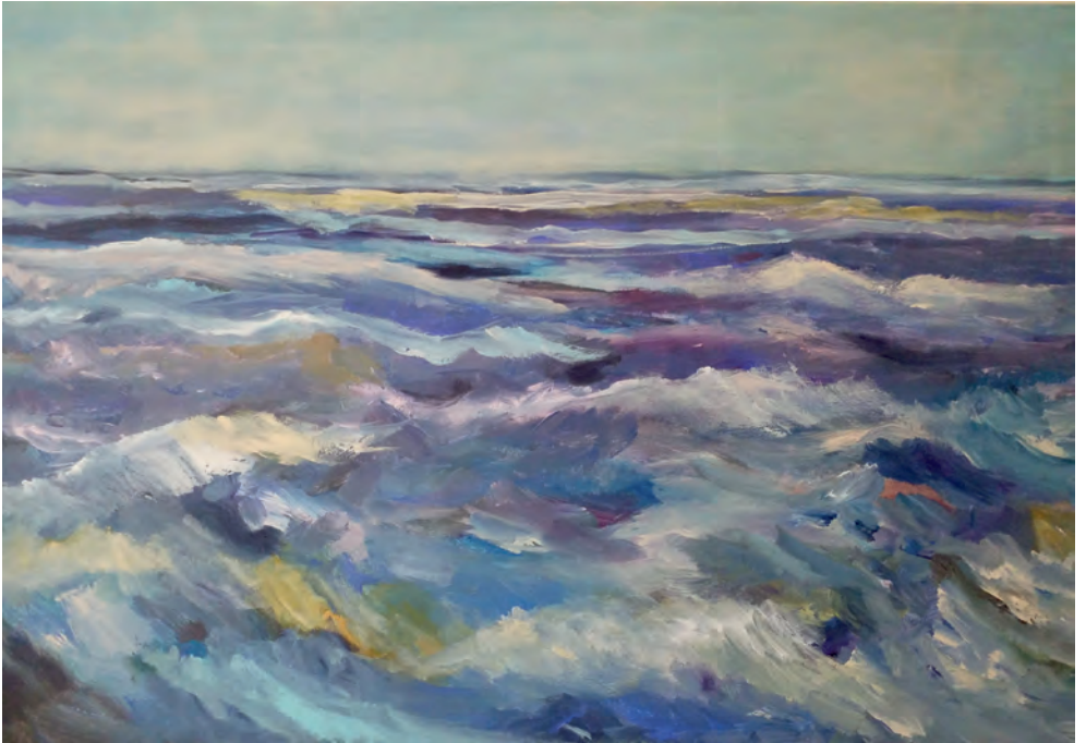
Usedom | 2021 80 x 120 cm | Acryl auf Leinwand