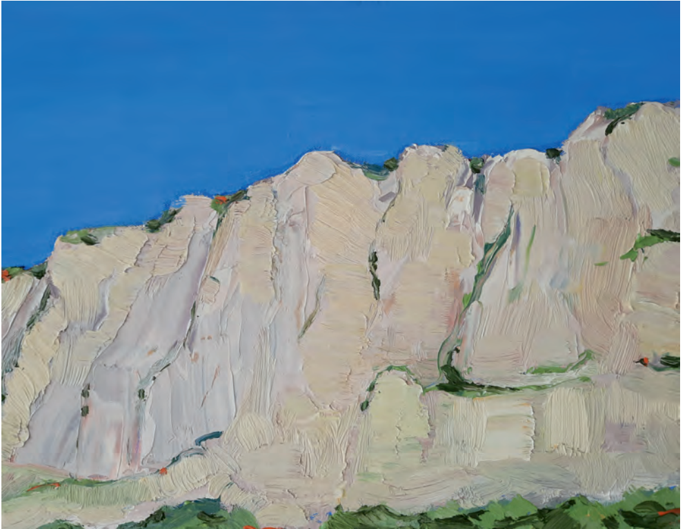
Étretat Steilküste | 2023 32 x 45 cm | Öl auf Leinen