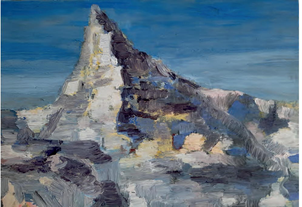
Matterhorn | 2023 30 x 40 cm | Öl auf Leinen