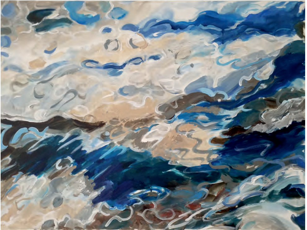
Fehmarn 4 | 2021 60 x 80 cm | Acryl auf Leinwand