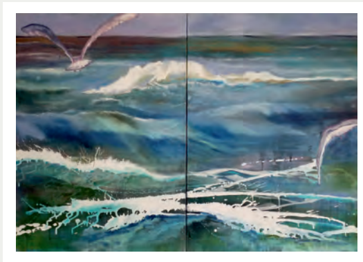
TITELBILD Adventure | 2018