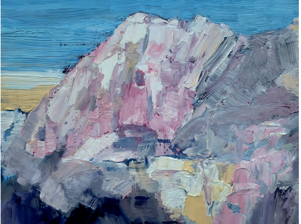
Lenzspitze | 2023 32 x 45 cm | Öl auf Leinen