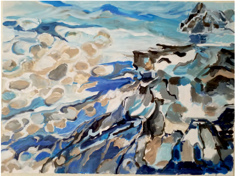
Fehmarn 3 | 2021 60 x 80 cm | Acryl auf Leinwand