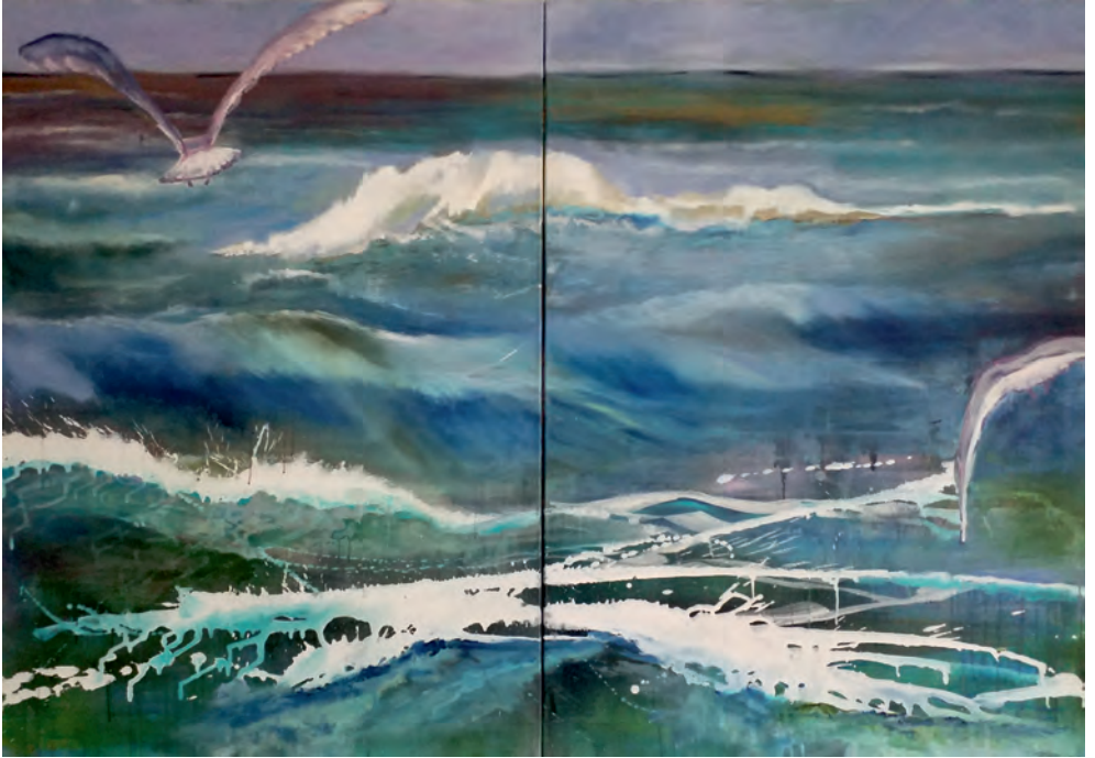
Adventure | 2018 140 x 200 cm | Acryl auf Leinwand