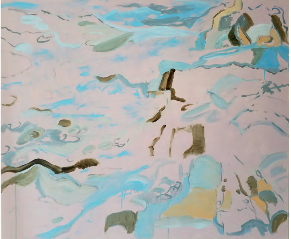
Fehmarn | 2021 100 x 120 cm | Acryl auf Leinwand