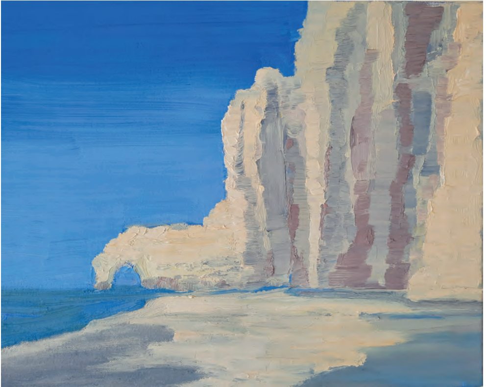
Étretat - La Falaise d'Amont | 2023 32 x 45 cm | Öl auf Leinen